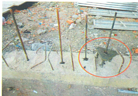
Hình 2. Mẫu sau khi thí nghiệm

25163 CÔNG TY CỔ PHẦN CỨU KỸ THUẬT ỨNG DỤNG BÁCH KHOA PHỐ CÂY