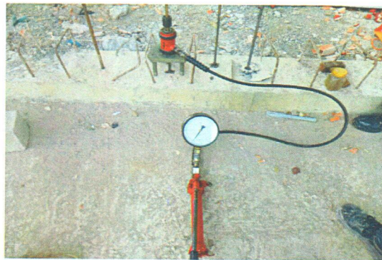
Hình 1. Mẫu trong quá trình thí nghiệm